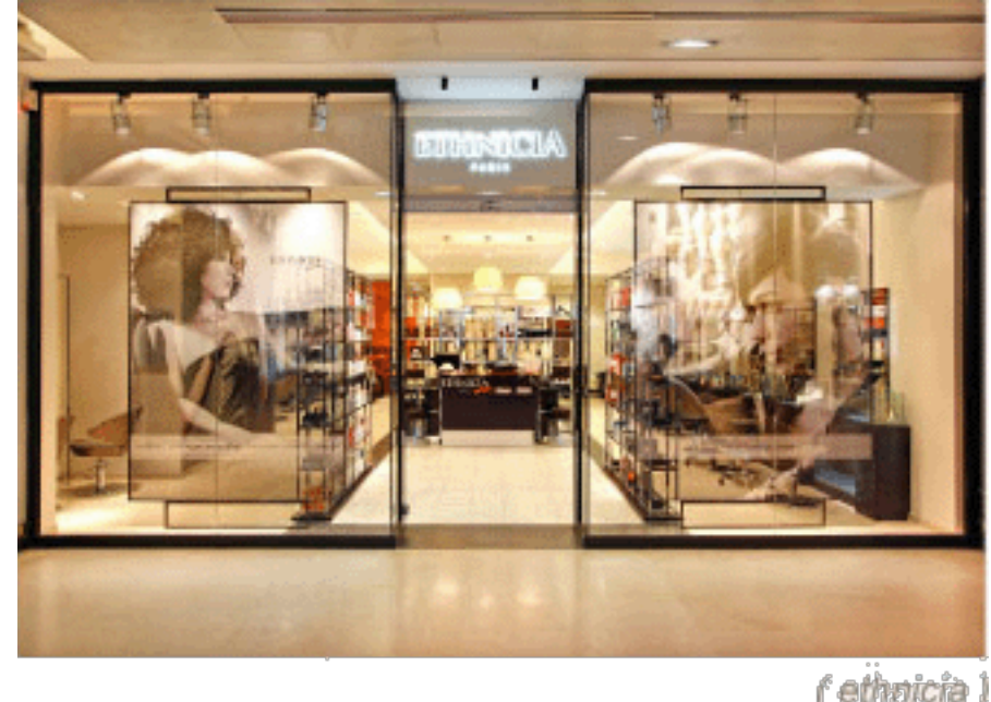
( ethnica )

Dernièrement, Ethnica a lancé sa gamme de vernis j'ai pu tester l'un des vernis et certains produits de la gamme de soins lors d'une manucure express.