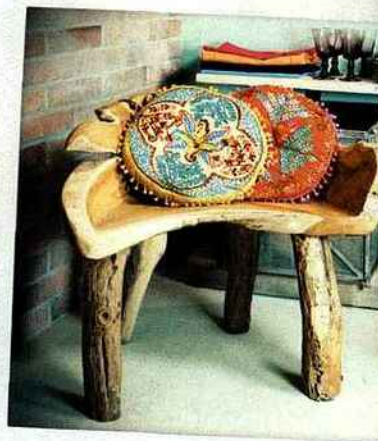
Jardin avec vues

Comme chaque année, on retrouve toutes les adresses tendance classées en cinq catégories : Art de vivre et décoration, Bien-être et loisirs, Gourmandises et restaurants, Mode et accessoires, Art et culture. Plus d'une centaine d'adresses incontournables.